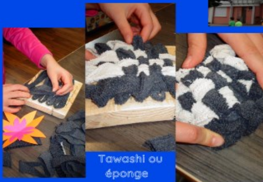
Tawashi ou éponge écolo .

Le matin ou le soir, avec Véro, nous nous amusons à recycler des chaussettes dépareillées ou usées en les transformant en Tawashi.